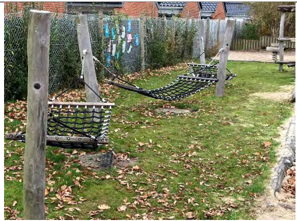
Redskab: Hængekøje Årgang: 2022 Producent: Guldborg Er redskabet mærket: Ja Er der registreret fejl/mangler: Nej