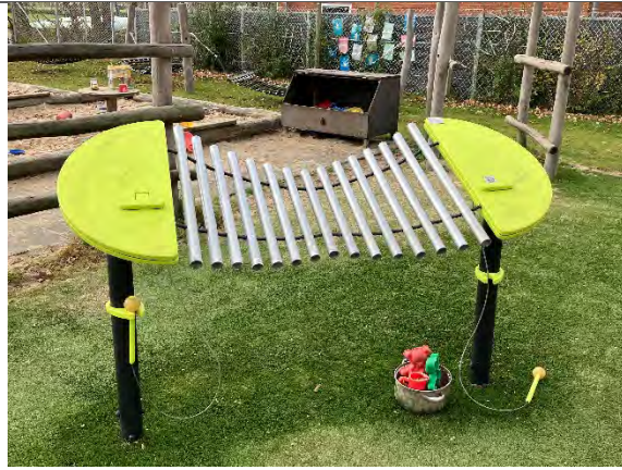
Redskab: Musikredskab Årgang: 2022 Producent: KbtMusik Er redskabet mærket: Ja Er der registreret fejl/mangler: Nej