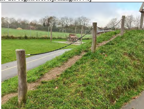
Redskab: Klatrereb Årgang: 2022 Producent: Nikoplay Er redskabet mærket: Ja Er der registreret fejl/mangler: Nej