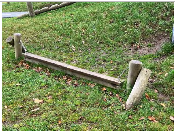
Redskab: Hængebom Årgang: 2022 Producent: Nikoplay Er redskabet mærket: Ja Er der registreret fejl/mangler: Nej