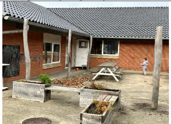
Redskab: Stolper til læsejl Producent: Er redskabet mærket: Nej Er der registreret fejl/mangler: Nej