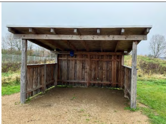
Redskab: Halvskur Ikke omfattet af DS/EN 1176