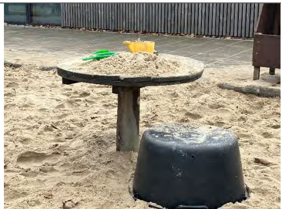
Redskab: Sandbord Årgang: 2022 Producent: Nikoplay Er redskabet mærket: Ja Er der registreret fejl/mangler: Nej