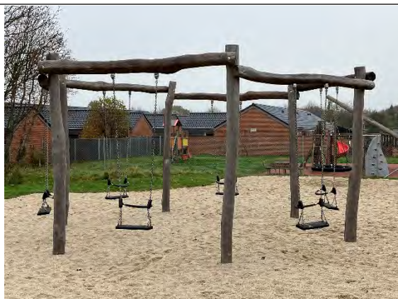
Redskab: Kontaktygyne Årgang: 2022 Producent: Nikoplay Er redskabet mærket: Ja Er der registreret fejl/mangler: Nej