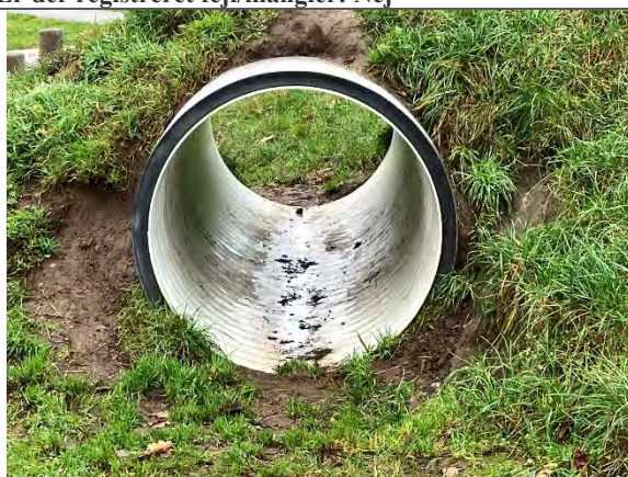
Redskab: Tunnel Årgang: 2022 Producent: Nikoplay Er redskabet mærket: Ja Er der registreret fejl/mangler: Nej