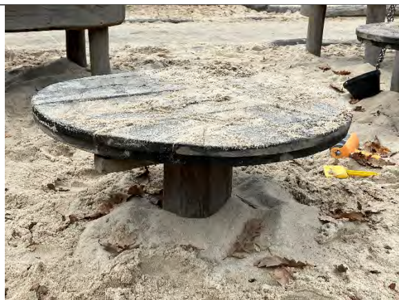
Redskab: Sandbord Årgang: 2022 Producent: Nikoplay Er redskabet mærket: Ja Er der registreret fejl/mangler: Nej