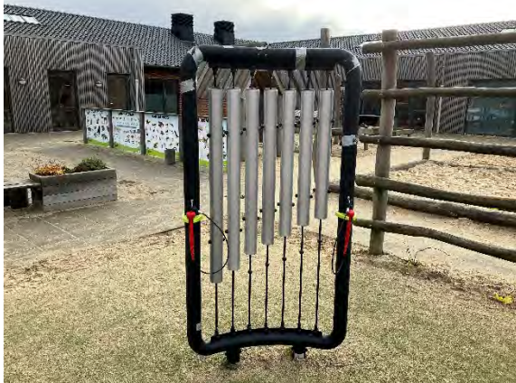
Redskab: Musikredskab Årgang: 2022 Producent: KbtMusik Er redskabet mærket: Ja Er der registreret fejl/mangler: Nej