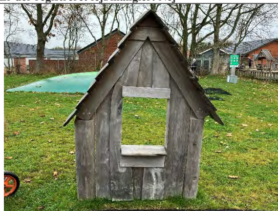
Redskab: Facade Årgang: 2022 Producent: Nikoplay Er redskabet mærket: Ja Er der registreret fejl/mangler: Nej