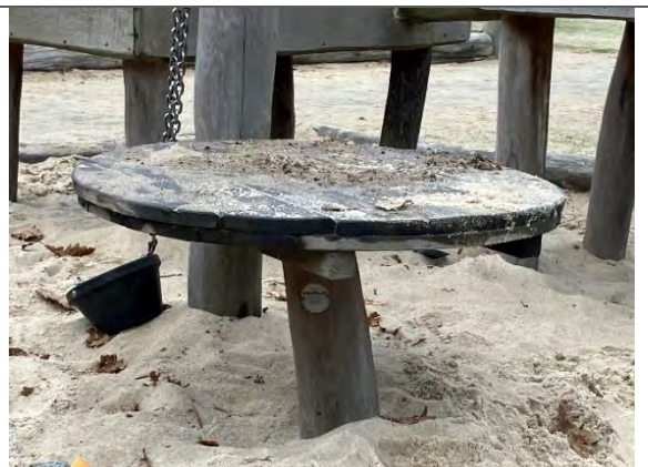
Redskab: Sandbord Årgang: 2022 Producent: Nikoplay Er redskabet mærket: Ja Er der registreret fejl/mangler: Nej