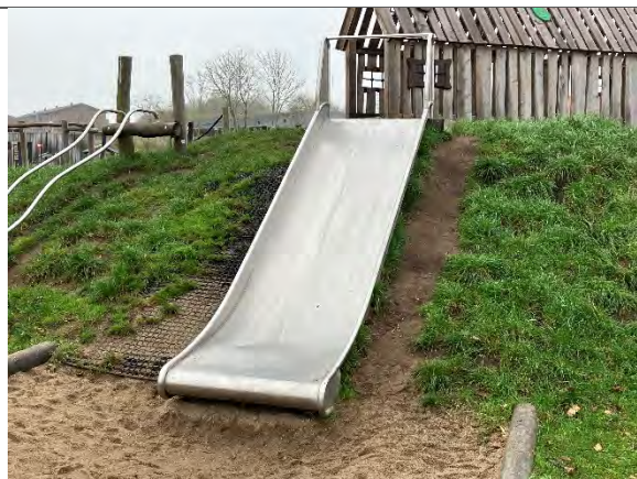
Redskab: Terrænruitsjebane Årgang: 2022 Producent: Nikoplay Er redskabet mærket: Ja Er der registreret fejl/mangler: Nej