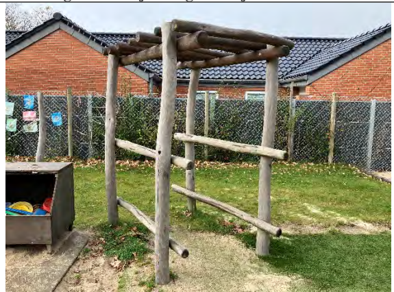
Redskab: Kravlebro Årgang: 2022 Producent: Nikoplay Er redskabet mærket: Ja Er der registreret fejl/mangler: Nej