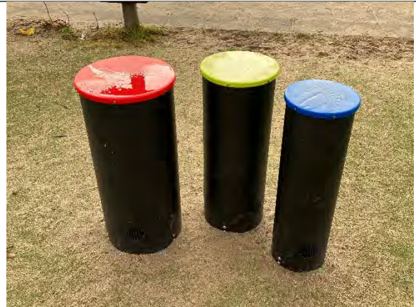
Redskab: Musikredskab Årgang: 2022 Producent: KbtMusik Er redskabet mærket: Ja Er der registreret fejl/mangler: Nej