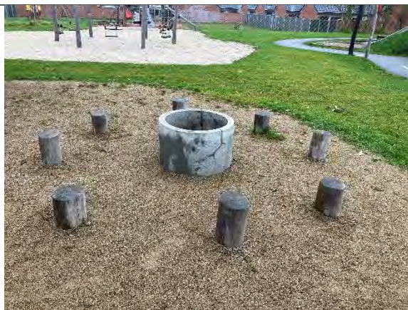
Redskab: Bålsted Ikke omfattet af DS/EN 1176