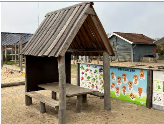
Redskab: Madpakkehus Årgang: 2022 Producent: Blaabjerg Trampolin og Legeservice Er redskabet mærket: Ja Er der registreret fejl/mangler: Nej