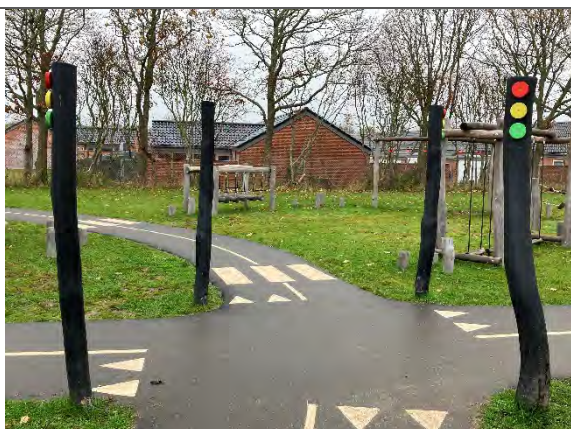
Redskab: færdselsskilte Årgang: 2022 Producent: Nikoplay Er redskabet mærket: Ja Er der registreret fejl/mangler: Nej