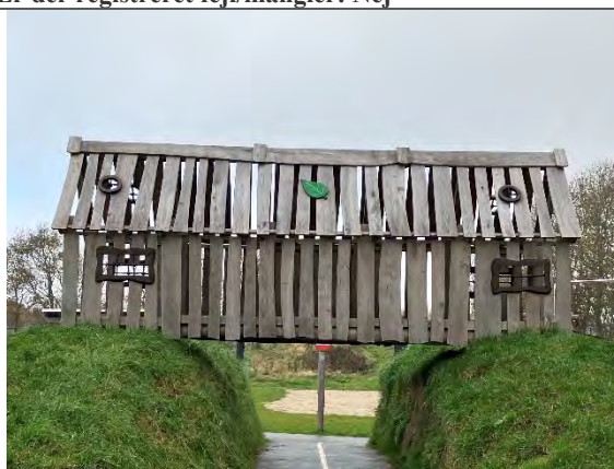
Redskab: Bro Årgang: 2022 Producent: Nikoplay Er redskabet mærket: Ja Er der registreret fejl/mangler: Nej