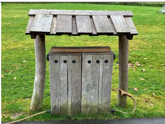
Redskab: Facade Årgang: 2022 Producent: Nikoplay Er redskabet mærket: Ja Er der registreret fejl/mangler: Nej