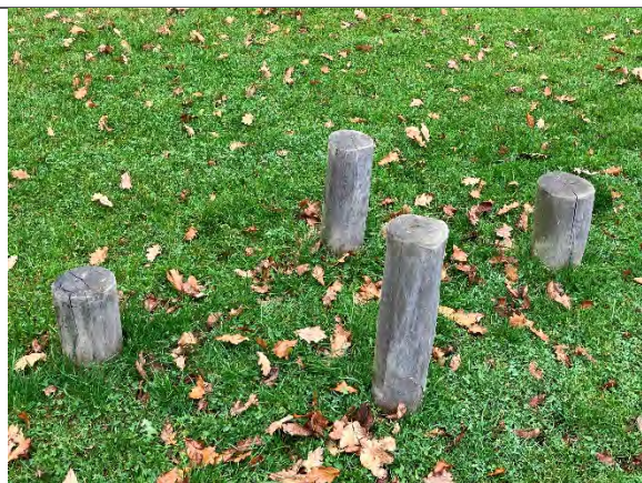
Redskab: Balancestolper Årgang: 2022 Producent: Nikoplay Er redskabet mærket: Ja Er der registreret fejl/mangler: Nej