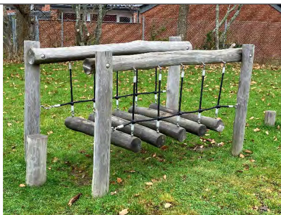
Redskab: Hængebro Årgang: 2022 Producent: Nikoplay Er redskabet mærket: Ja Er der registreret fejl/mangler: Nej