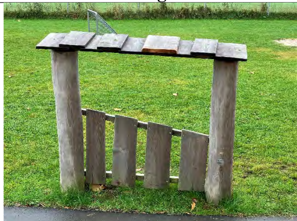
Redskab: Facade Årgang: 2022 Producent: Nikoplay Er redskabet mærket: Ja Er der registreret fejl/mangler: Nej