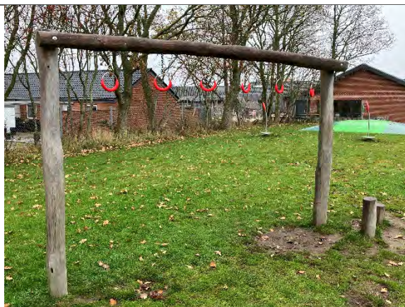
Redskab: Armgang Årgang: 2022 Producent: Nikoplay Er redskabet mærket: Ja Er der registreret fejl/mangler: Nej