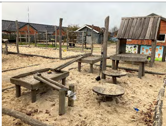
Redskab: Vandleg Årgang: 2022 Producent: Nikoplay Er redskabet mærket: Ja Er der registreret fejl/mangler: Nej