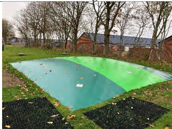
Redskab: Hoppepude Ikke omfattet af DS/EN 1176