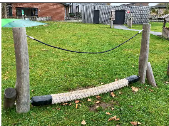
Redskab: Hængebro med støttere Årgang: 2022 Producent: Nikoplay Er redskabet mærket: Ja Er der registreret fejl/mangler: Nej