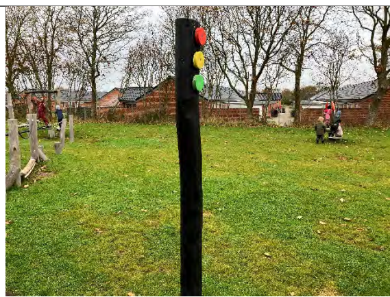
Redskab: Færdselsskilt Årgang: 2022 Producent: Nikoplay Er redskabet mærket: Ja Er der registreret fejl/mangler: Nej