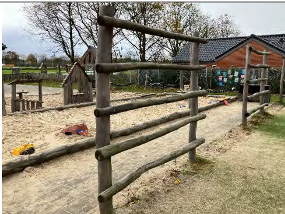
Redskab: Kravlevæg Årgang: 2022 Producent: Nikoplay Er redskabet mærket: Ja Er der registreret fejl/mangler: Nej