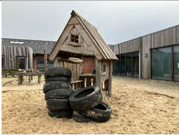
Redskab: Legehus Årgang: 2022 Producent: Nikoplay Er redskabet mærket: Ja Er der registreret fejl/mangler: Nej