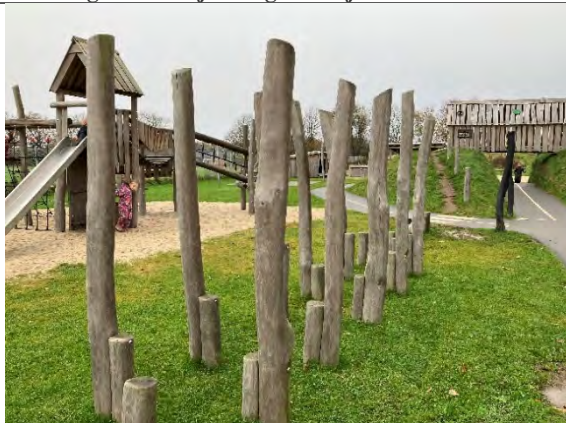
Redskab: Stylder Årgang: 2022 Producent: Nikoplay Er redskabet mærket: Ja Er der registreret fejl/mangler: Nej