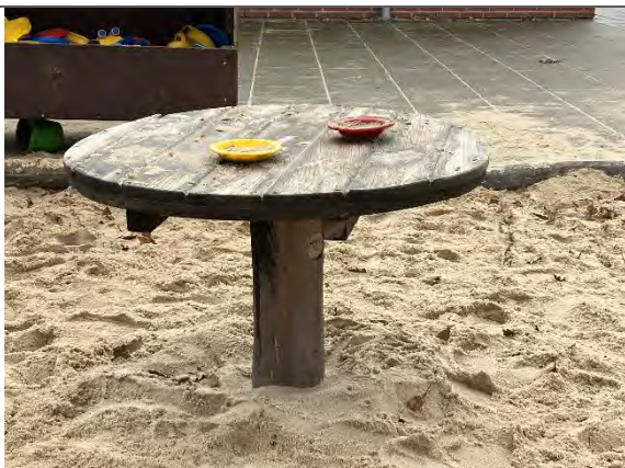
Redskab: Sandbord Årgang: 2022 Producent: Nikoplay Er redskabet mærket: Ja Er der registreret fejl/mangler: Nej