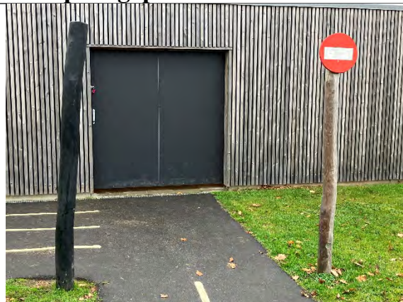
Redskab: Færdselsskilte Årgang: 2022 Producent: Nikoplay Er redskabet mærket: Ja Er der registreret fejl/mangler: Nej