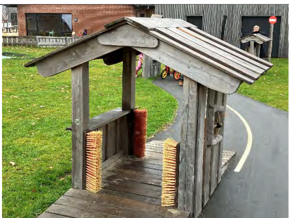
Redskab: Vaskehal Årgang: 2022 Producent: Nikoplay Er redskabet mærket: Ja Er der registreret fejl/mangler: Nej