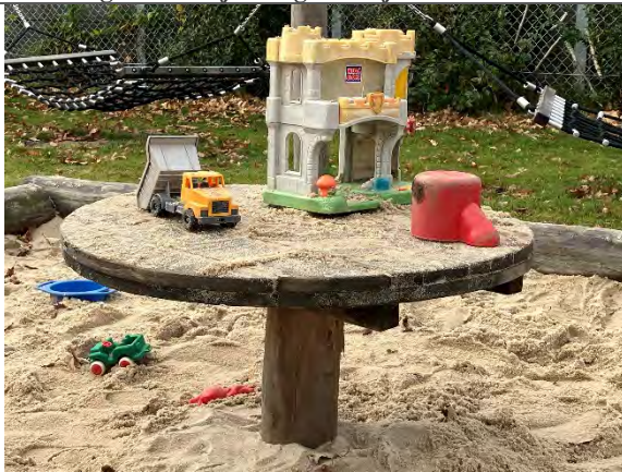
Redskab: Sandbord Årgang: 2022 Producent: Nikoplay Er redskabet mærket: Ja Er der registreret fejl/mangler: Nej