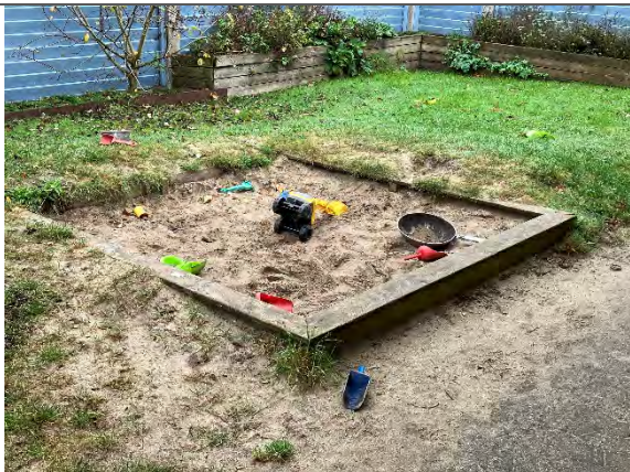
Redskab: Sandkasse Årgang: Producent: Er redskabet mærket: Ja – men ulæseligt Er der registreret fejl/mangler: Nej