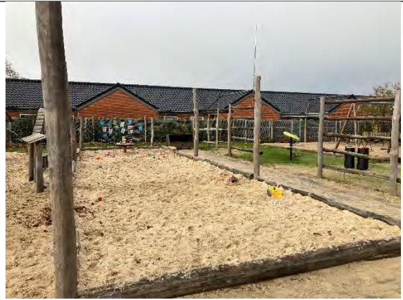
Redskab: Sandkasse med stolper til læsejl Årgang: 2022 Producent: Nikoplay Er redskabet mærket: Ja Er der registreret fejl/mangler: Nej