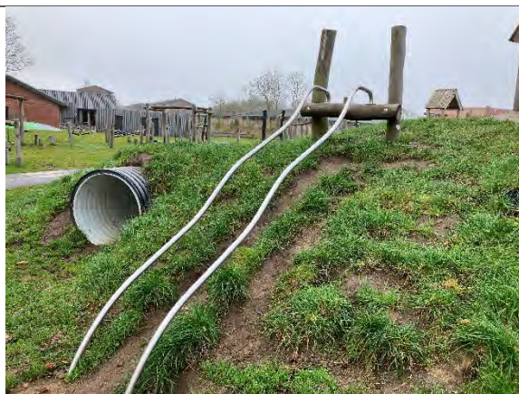
Redskab: Gliderør Årgang: 2022 Producent: Nikoplay Er redskabet mærket: Ja Er der registreret fejl/mangler: Nej