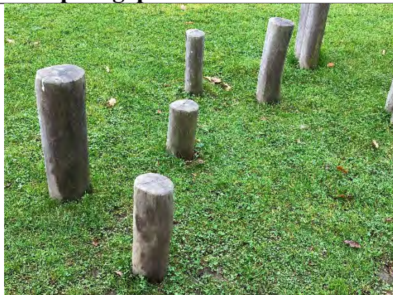
Redskab: Balancestolper Årgang: 2022 Producent: Nikoplay Er redskabet mærket: Ja Er der registreret fejl/mangler: Nej