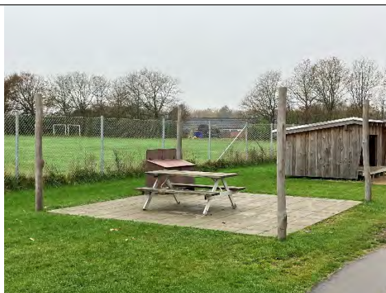
Redskab: Stolper til læsejl Årgang: 2022 Producent: Nikoplay Er redskabet mærket: Ja Er der registreret fejl/mangler: Nej