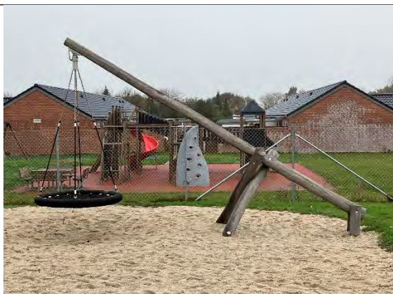
Redskab: Etpunktgyng Årgang: 2022 Producent: Nikoplay Er redskabet mærket: Ja Er der registreret fejl/mangler: Nej