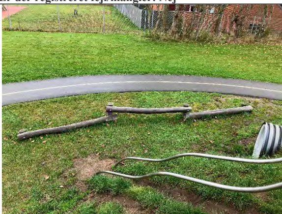
Redskab: Balancebomme Årgang: 2022 Producent: Nikoplay Er redskabet mærket: Ja Er der registreret fejl/mangler: Nej