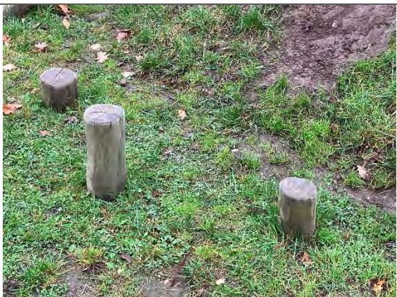
Redskab: Balancestolper Årgang: 2022 Producent: Nikoplay Er redskabet mærket: Ja Er der registreret fejl/mangler: Nej