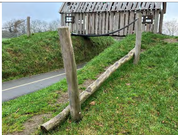
Redskab: Hønsetrappelpe Årgang: 2022 Producent: Nikoplay Er redskabet mærket: Ja Er der registreret fejl/mangler: Nej