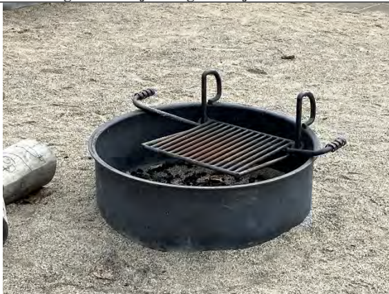
Redskab: Bålsted Ikke omfattet af DS/EN 1176