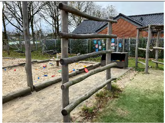
Redskab: Kravlevæg Årgang: 2022 Producent: Nikoplay Er redskabet mærket: Ja Er der registreret fejl/mangler: Nej