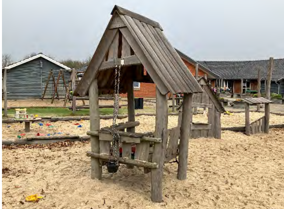
Redskab: Facade Årgang: 2022 Producent: Nikoplay Er redskabet mærket: Ja Er der registreret fejl/mangler: Nej