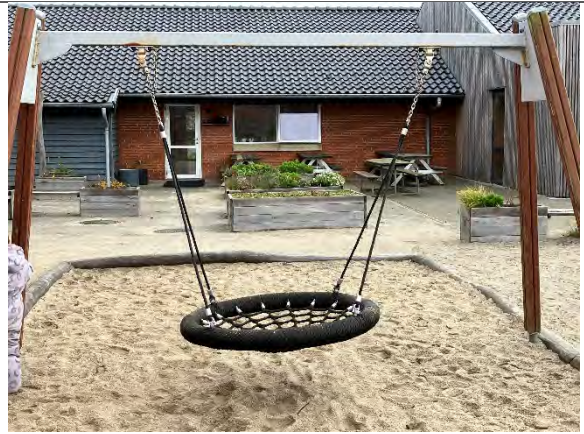
Redskab: Fugleredegynge Årgang: Producent: Lappset Er redskabet mærket: Nej Er der registreret fejl/mangler: Nej