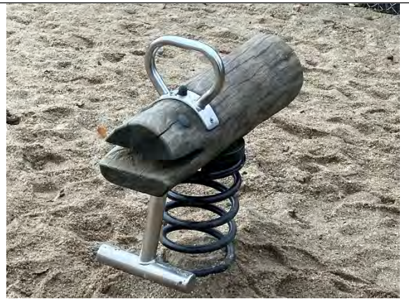
Redskab: Årgang: 2022 Producent: Nikoplay Er redskabet mærket: Ja Er der registreret fejl/mangler: Nej