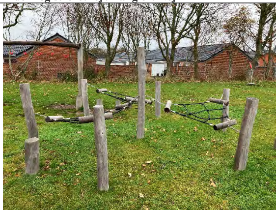
Redskab: Hængekøjer Årgang: 2022 Producent: Nikoplay Er redskabet mærket: Ja Er der registreret fejl/mangler: Nej