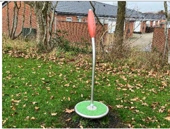
Redskab: Spinner Årgang: 2022 Producent: Nikoplay Er redskabet mærket: Ja Er der registreret fejl/mangler: Nej