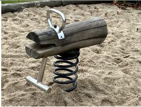
Redskab: Vippedyr Årgang: Producent: Er redskabet mærket: Ja Er der registreret fejl/mangler: Nej