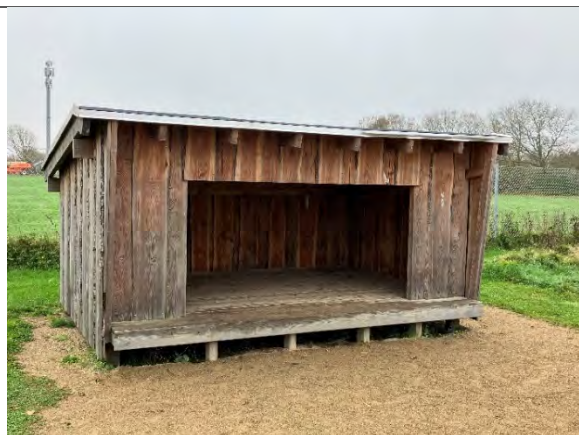
Redskab: Shelter Ikke omfattet af DS/EN 1176