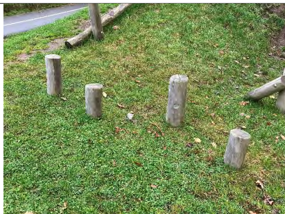
Redskab: Balancestolper Årgang: 2022 Producent: Nikoplay Er redskabet mærket: Ja Er der registreret fejl/mangler: Nej