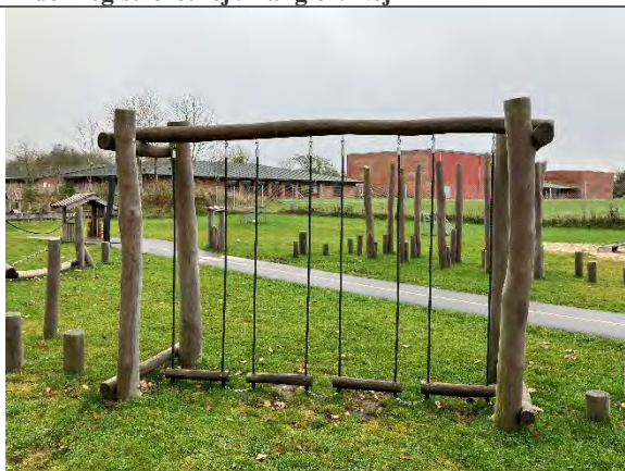
Redskab: Hængebro Årgang: 2022 Producent: Nikoplay Er redskabet mærket: Ja Er der registreret fejl/mangler: Nej