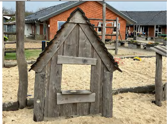
Redskab: Facade Årgang: 2022 Producent: Nikoplay Er redskabet mærket: Ja Er der registreret fejl/mangler: Nej