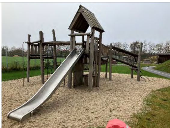
Redskab: Klatrestativ med rutsjebane Årgang: 2022 Producent: Nikoplay Er redskabet mærket: Ja Er der registreret fejl/mangler: Nej