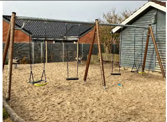
Redskab: Gyngestativ Årgang: Producent: Hags Er redskabet mærket: Ja Er der registreret fejl/mangler: Nej