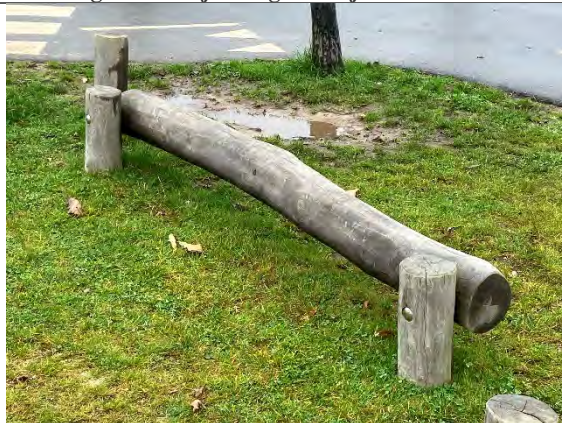
Redskab: Balancebom Årgang: 2022 Producent: Nikoplay Er redskabet mærket: Ja Er der registreret fejl/mangler: Nej