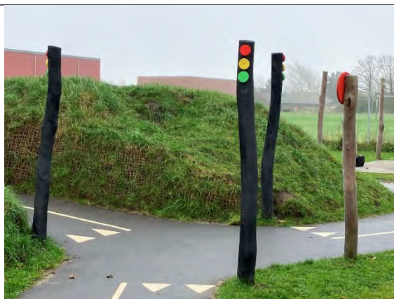
Redskab: Førselsskilte Årgang: 2022 Producent: Nikoplay Er redskabet mærket: Ja Er der registreret fejl/mangler: Nej