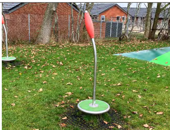
Redskab: Spinner Årgang: 2022 Producent: Nikoplay Er redskabet mærket: Ja Er der registreret fejl/mangler: Nej